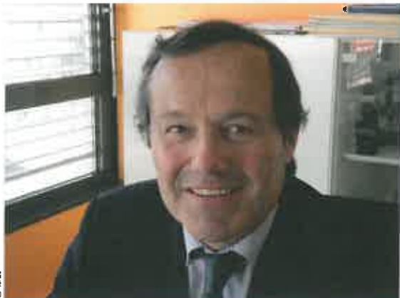
© DR D r Gilles Walch