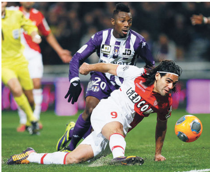
Figura. Radamel Falcao en un partido anterior del Mónaco.

Noronha, eminencia en rodillas, será quien opere al colombiano